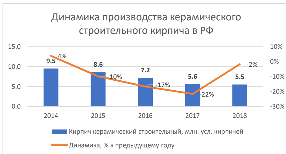
Диаграмма 2. Динамика производства керамического строительного кирпича в РФ

По данным Росстата за последние * лет объемы производства керамического строительного кирпича в РФ значительно снизились. Наглядно это представлено на следующей диаграмме.